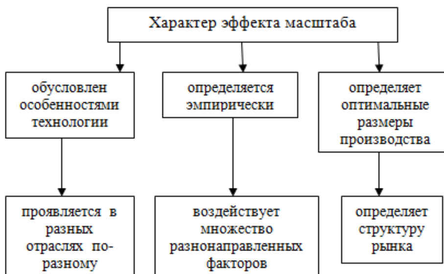
Рис. 3.1. Характеристика эффекта масштаба Составлено по материалам: [49, с. 23]

Объемные иллюстрации целесообразно выносить в приложения.